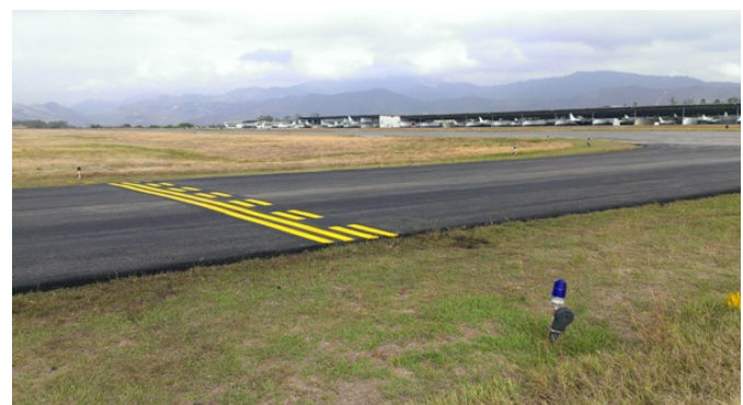
Señal de Punto de Espera.