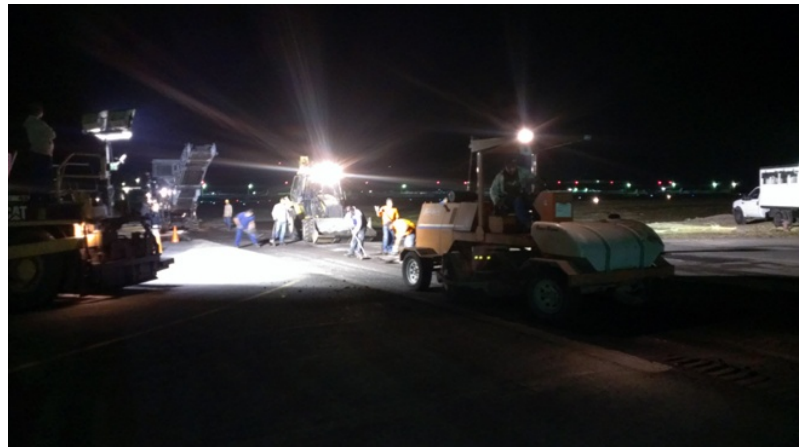
Bacheo en Calle de Rodaje

Prosiguiendo nuestro plan continuo de mantenimiento de pavimentos, a partir del 10 de febrero recomenzamos los trabajos de asfaltado con varias jornadas iniciales de trabajo nocturno para reconstruir el pavimento en la calle de rodaje que comunica la Pista con la Plataforma Internacional.