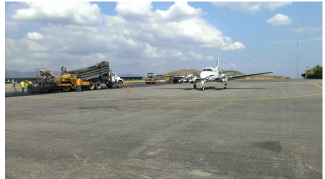
Sin interrumpir operaciones

Continuamos los trabajos con la repavimentación de la Vía perimetral Sur frente a la Torre de Control, el Estacionamiento del Terminal Internacional y un área de la Vía Perimetral Norte que se encontraba muy deteriorada. Además se ejecutaron trabajos de bacheo en otras áreas.