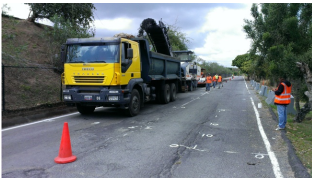
Fresado en Vía Perimetral Norte

Continuamos los trabajos con la repavimentación de la Vía perimetral Sur frente a la Torre de Control, el Estacionamiento del Terminal Internacional y un área de la Vía Perimetral Norte que se encontraba muy deteriorada. Además se ejecutaron trabajos de bacheo en otras áreas.