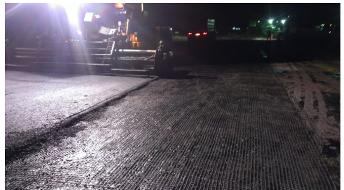
Refuerzo estructural con asfalto